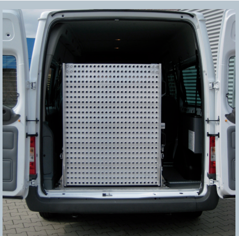
Eingeklappte Eurorampe in Ruhestellung im Fahrzeugheck.