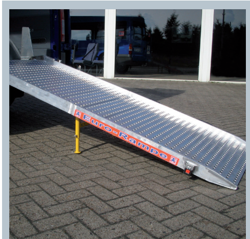
Eurorampe mit Abstützung. Die Tragfähigkeit erhöht sich um 200 kg.