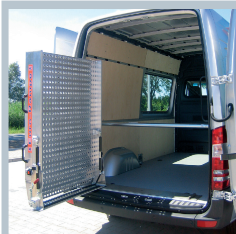
Fahrzeug mit schwenkbarer Eurorampe.